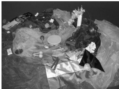
Weltgebetstag der Frauen