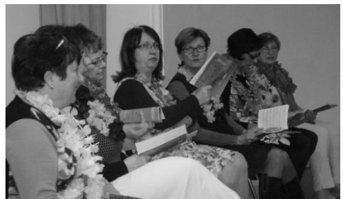
Frauenliturgie am Weltgebetstag